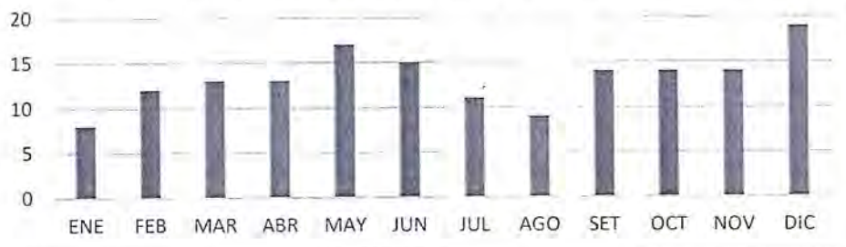
APROBACION DE SOLICITUDES DE MODIFICACIONES DE CUADRO DE NECESIDADES

2.13 Asimismo, en el ejercicio fiscal 2025 se realizaron modificaciones, siendo el mes de diciembre que se realizó más aprobaciones de Anexo 4: Aprobación de Modificaciones al Cuadro Multianual de Necesidades con 19 aprobaciones respectivamente, teniendo un promedio de 13 aprobaciones de modificación del Cuadro Multianual de Necesidades.